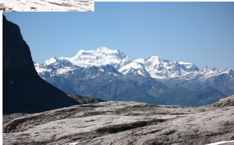
Le Grand Combin