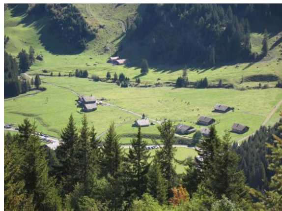
Le plateau de Barme